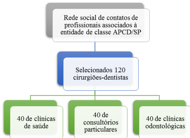
Figura 7- Amostra de pesquisa

saúde, e 40 que atuavam em consultórios odontológicos individuais, conforme ilustrado na Figura 7.