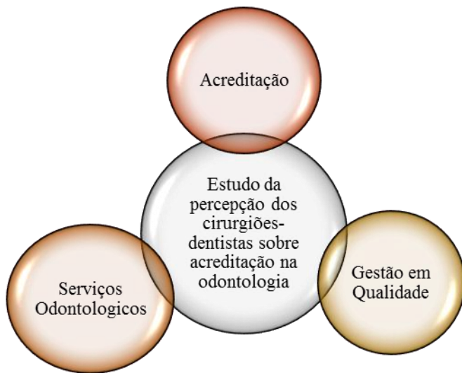
Figura 2 - Polarização teórica do estudo

Nesta fase da pesquisa foram analisados os pressupostos, com base na Revisão da Literatura apresentada no Capítulo 2, que consta de um levantamento sobre os principais polos teóricos discutidos no presente trabalho. O levantamento bibliográfico abordou principalmente questões referentes à gestão da qualidade, acreditação e serviços odontológicos, com a intenção de constituir o delineamento teórico que fundamenta o objetivo principal da pesquisa, conforme pode ser observado na Figura 2.